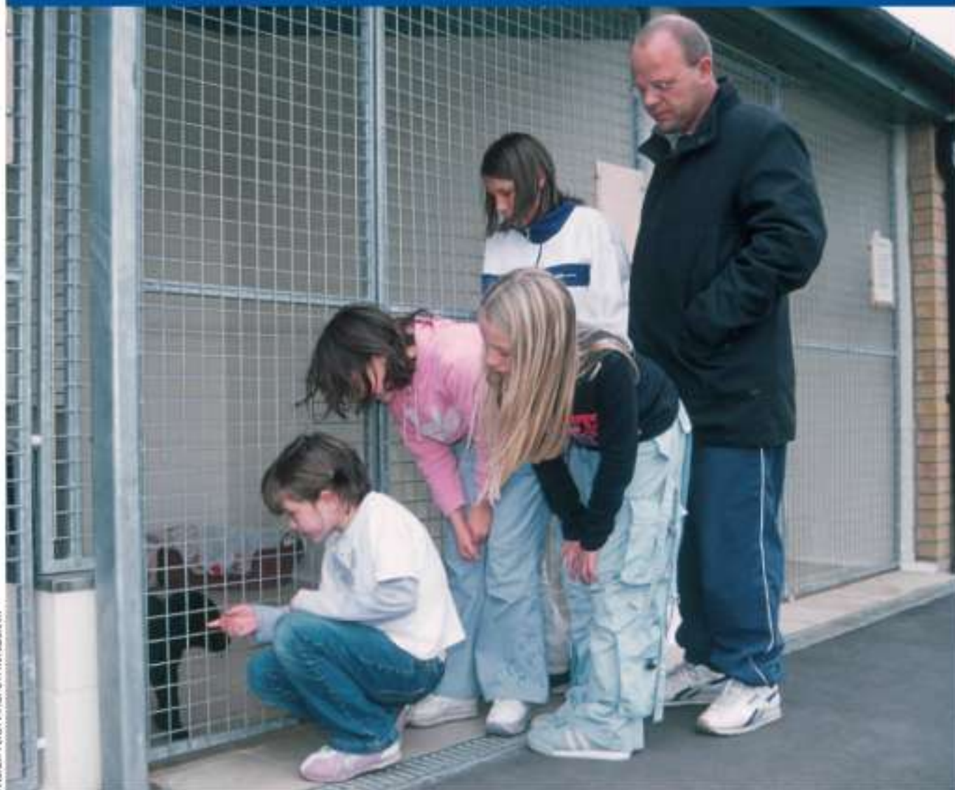
Family looking at a dog waiting to be rehomed at an animal centre

Ще трябва да измерите съотношението между реалните разходи по въвеждане на политиката и очакваните ползи от нея за вашето развитие .