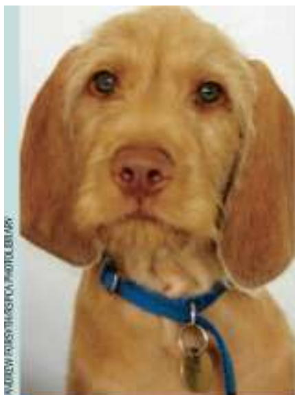
ABOVE: Hungarian wire-haired vizsla