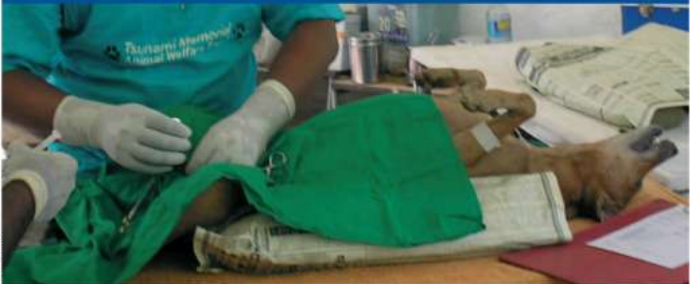
Neutering policy being put into practice in Sri Lanka

Вариант 4: Кастрация само на женските Този вариант е по-скъп, въпреки това ползата е в това, че той намалява риска от пиометра (инфекция на матката), също така може да се увеличат шансовете за намиране на дом на животното, тъй като то вече не се разгонва.