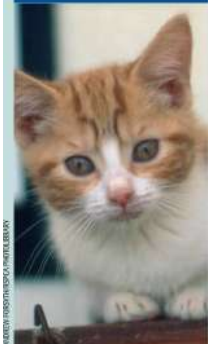
BELOW: Kitten in an RSPCA animal centre