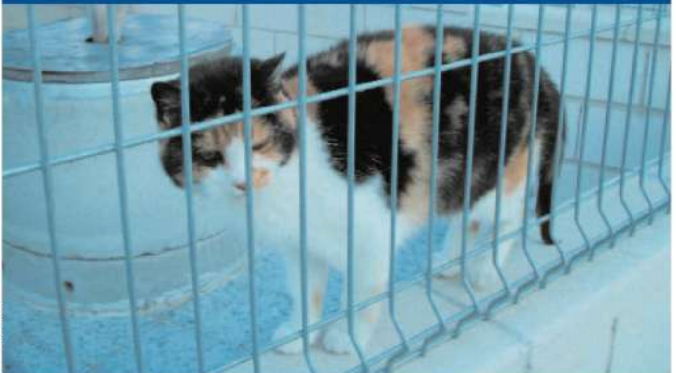
Cattery at an animal shelter in Madrid